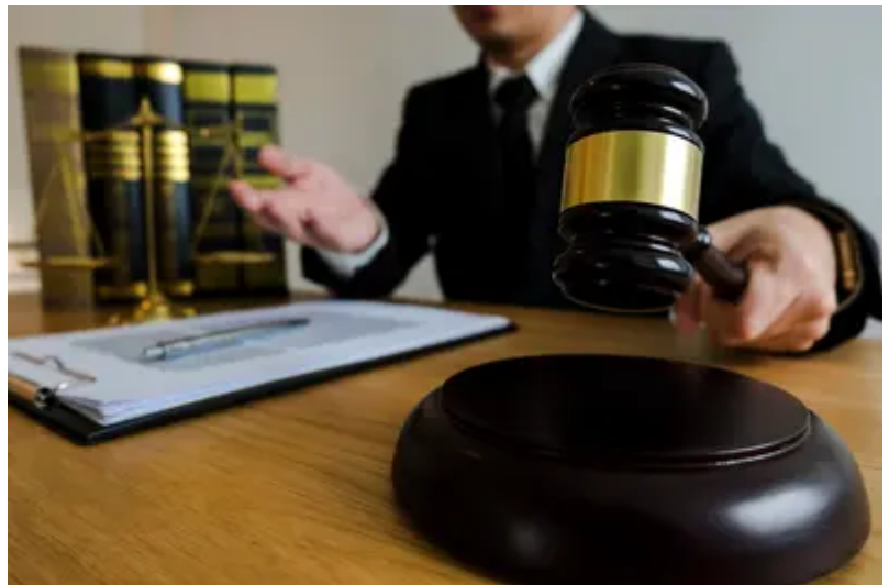
Photo 142867899 | Courtroom

Die Frage ist: Sind diese historischen Dokumente zuverlässig? Können wir ihnen vertrauen? Eine Möglichkeit, um festzustellen, ob die Dokumente zuverlässig sind, besteht darin, die Personen, die sie verfasst haben, einer Prüfung zu unterziehen, wie sie ein guter Richter oder Staatsanwalt durchführen würde. Die Glaubwürdigkeit dieser Zeugen hängt dabei von fünf Dingen ab: von ihrer Aufrichtigkeit, von ihrer Eignung, von der Anzahl der Zeugen und ihrer